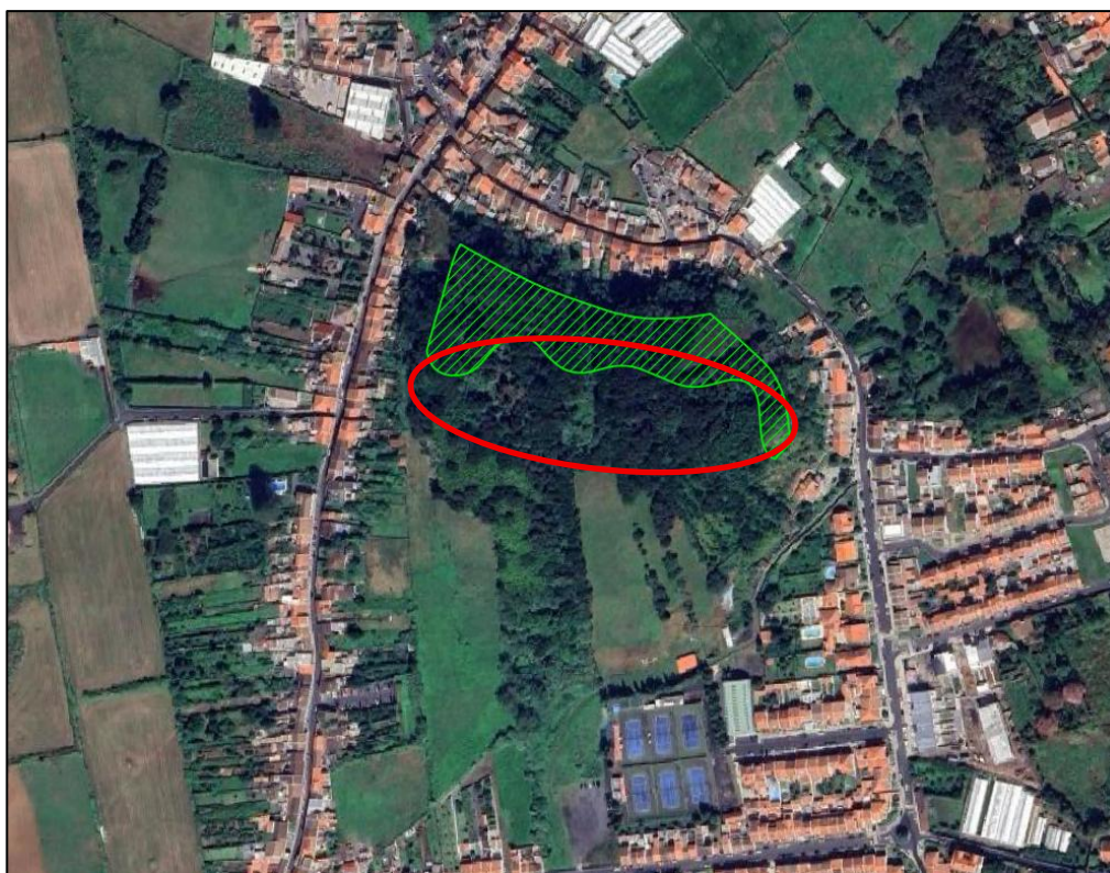
Figura 2 – Proposta (perímetro a vermelho) para aumentar a categoria de Espaços Florestais da PO I da rPDMPD (trama a verde).